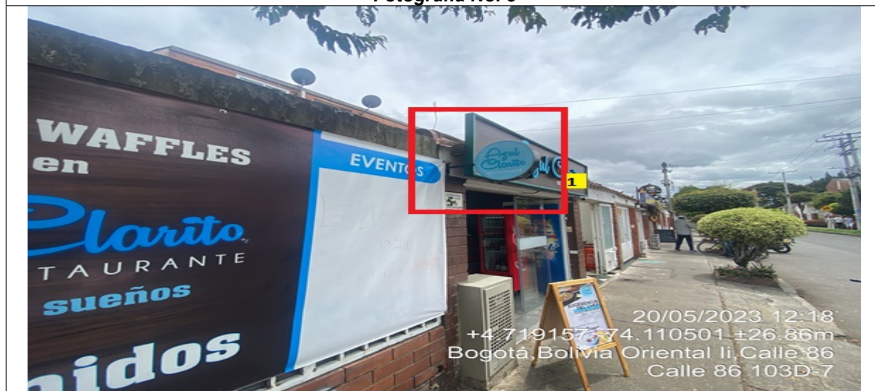
En la cual se evidencia un (1) elemento PEV identificado con el número 1 perteneciente al establecimiento comercial “AZUL CLARITO” propiedad de la sociedad “INVERSIONES Y ASESORIAS TERRANOVA SAS”, el cual se encuentra volado de la fachada del establecimiento comercial.