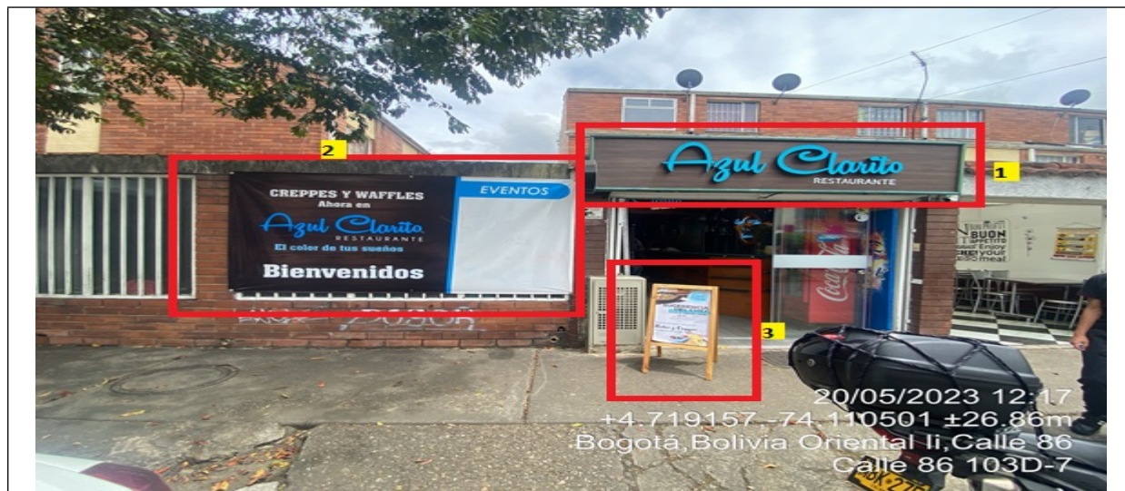
Vista panorámica del establecimiento comercial “AZUL CLARITO” propiedad de la sociedad “INVERSIONES Y ASESORIAS TERRANOVA SAS” en la que se evidencia un (1) elemento tipo aviso en fachada identificado con el número 1 el cual se encuentra saliente de la fachada, así mismo, un (1) elemento de PEV identificado con el número 2 ubicado a las ventanas de la edificación, y un elemento no autorizado identificado con el número 3 el cual se encuentra en área de espacio público.